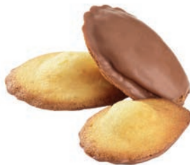
Chocolat au lait